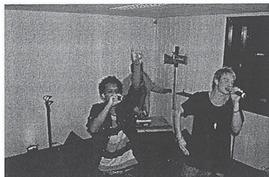
KeSera Konsert på klubben 2011

Virksomheten er Gjøkeredet fritidsklubb. Målsettingen for fritidsklubben: Et sted å være et sted å lære. I det ligger det at klubben skal være et uforpliktende tilbud, men også gi muligheten for lærdom og vekst. Et forebyggende tiltak. Klubben skal være rusfri og arbeide for et rusfritt miljø. Klubben skal samtidig bringe barn og ungdom, med ulike minoritets bakgrunn fra de forskjellige land sammen til gjensidig dans og moro. Fokus på dette blir å skape kommunikasjon mellom ungdommene og samspill, mellom de ulike aktivitetene som klubben har å tilby.